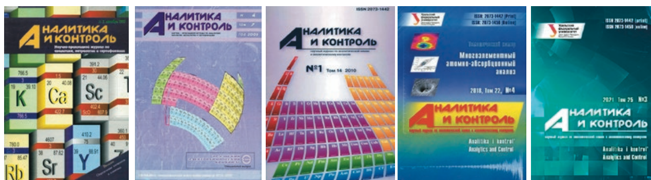
Рис. 2. Примеры эволюции обложек журнала «Аналитика и контроль»