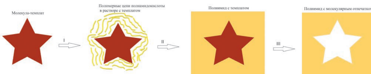
Рис. 1. Схема синтеза полимера с молекулярными отпечатками на основе полиимида: I – образование комплекса между молекулой-темплатом и полимерными цепями полиамидокислоты в растворе; II – термоимидизация с образованием полиимида с темплатом; III – удаление молекулы-темплата с образованием в полимере отпечатков.

где \Delta f_{\text{ПМО}} – разностная частота колебаний сенсора на основе ПМО; C – концентрация определяемого вещества.