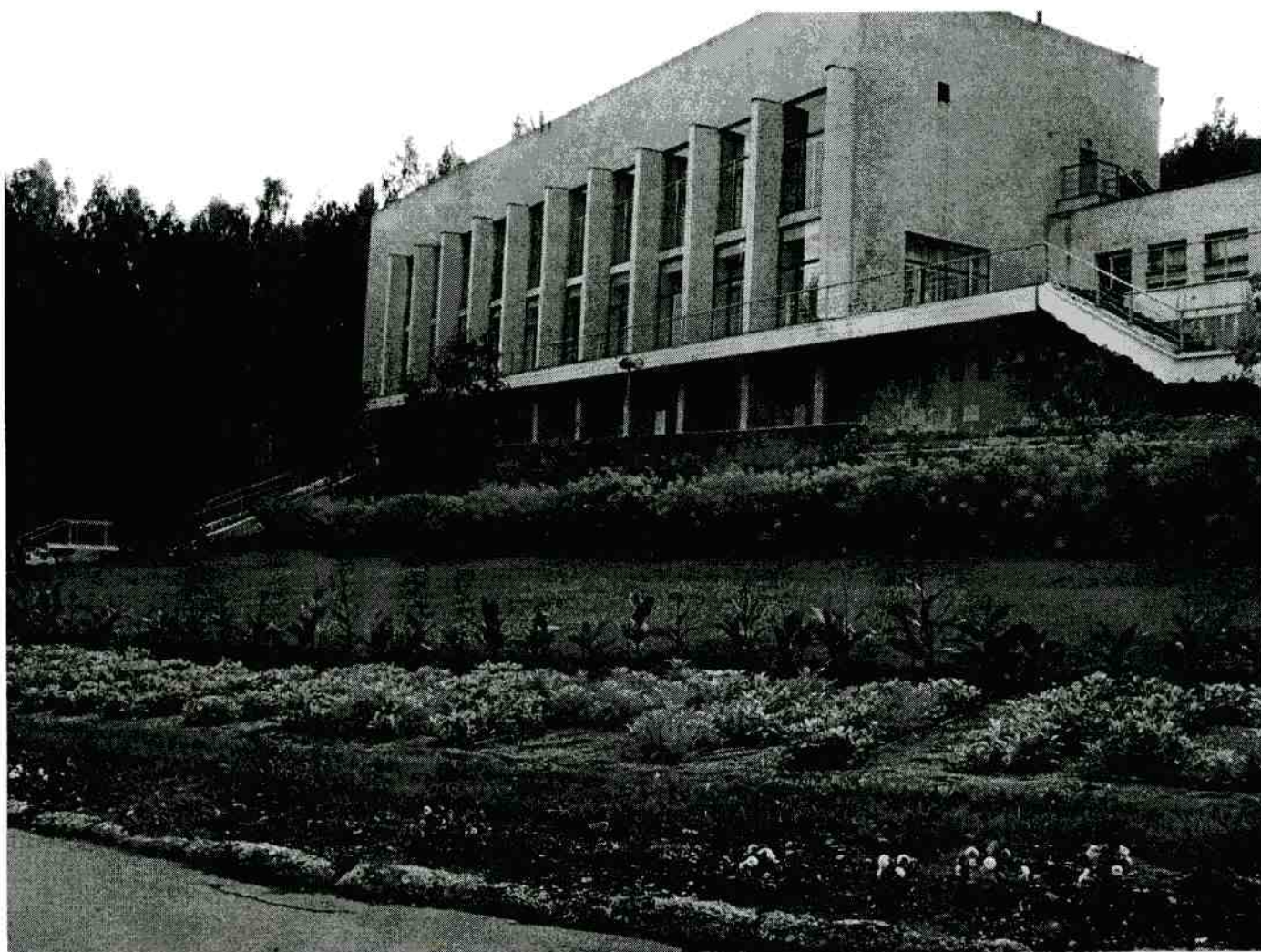
Корпус для проведения заседаний и выставок

Пасмурная погода не помешала собраться аналитикам, чья приверженность спектроскопии и спектральным методам анализа не вызывает сомнений. ЗАО Санаторий «Зеленый мыс» Российского профессионального Союза работников атомной энергетики и промышленности расположен недалеко от озера Таватуй – жемчужины Среднего Урала, на берегу Верх-Нейвинского пруда. Его плотина была сооружена по распоряжению Прокопия Демидова в 1764 г., в 100 км от г.Екатеринбурга. Подъем воды позволил по протоке соединить пруд с озером Таватуй. Общая длина водной поверхности составляет около 18 км. Прилегающая лечебно-оздоровительная зона площадью 453 га занята хвойными лесами с преобладанием сосны и ели. На данной широте проходит южная граница ареала кедра на Урале. Кроме того, в 27 км севернее расположен г. Невьянск, вотчина династии Демидовых в 18-19 веках с ее знаменитой наклонной башней, построенной в 1732 г.