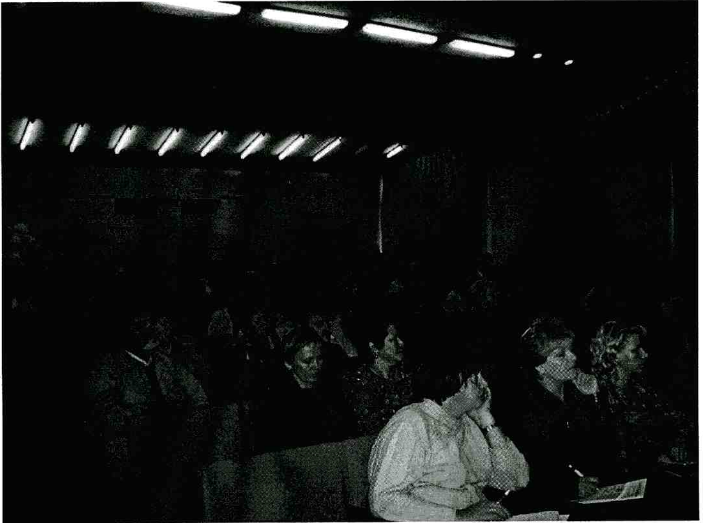
В зале заседаний

Прием участников конференции и регистрация проходила непосредственно на месте проведения в «Зеленом мысу». Участники были доставлены автобусами от УГТУ-УПИ 9-го и 10-го сентября с.г. по живописной дороге вдоль границы «Европа-Азия». Многие приезжали самостоятельно на один-два дня. Они обеспечивались проживанием (кому было необходимо) и питанием. Размещение участников было хорошим: 1, 2 или 3-х местные номера с телевизором и телефоном. Всего в конференции приняло участие 215 человек от аналитических служб предприятий и организаций различных отраслей, институтов РАН и ВУЗов из 22 регионов и 46 городов Российской Федерации и стран СНГ (Азербайджана, Белоруссии и Украины), а также 8 отечественных и 12 зарубежных фирм – производителей аналитического оборудования (из Австрии, Германии, США, Швейцарии, Финляндии, Франции, Японии).