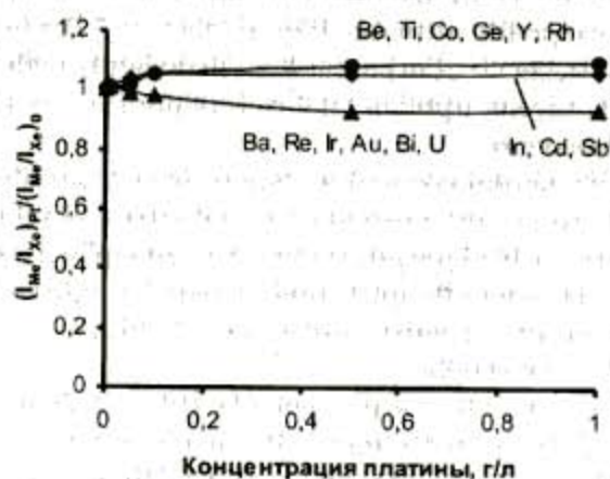
Рис. 3. Зависимость отношения интенсивностей аналитических сигналов элемента в растворе, содержащем платину, и в растворе, не содержащем платину (I_M/Xe)_p/(I_M/Xe)_0 , от концентрации платины с применением внутреннего стандарта ксенона

платину I_p , к интенсивности аналитического сигнала определяемого элемента в растворе, не содержащем платину I_0 от концентрации платины без использования внутреннего стандарта и с использованием ^{129}\text{Xe} и ^{139}\text{La} соответственно. В таблице показана степень открываемости добавки (К, %) для различных групп элементов при различных концентрациях платины.