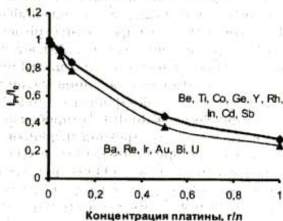
Рис. 2. Зависимость отношения интенсивностей аналитических сигналов элемента в растворе, содержащем платину, и в растворе, не содержащем платину I_p/I_0 , от концентрации платины

На рис. 2, 3 и 4 приведены зависимости отношений интенсивности аналитического сигнала определяемого элемента в растворе, содержащем